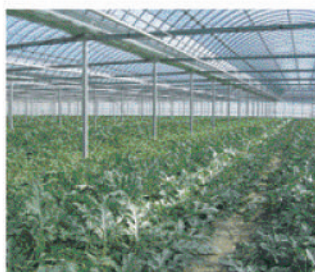
静岡県 ハウス栽培