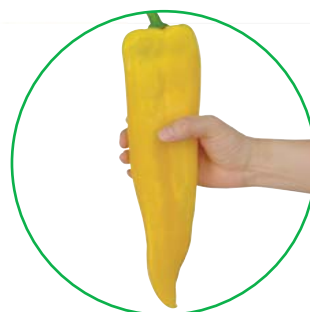
パブロンダゴールド